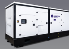
DGCS 1110 ST