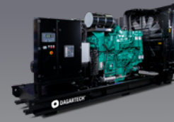
DGC 860 ST