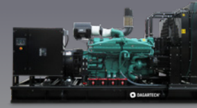
DGC 1230 ST -

• Uso recomendado para aplicaciones Standby. Datos de Potencia PRP orientativos.