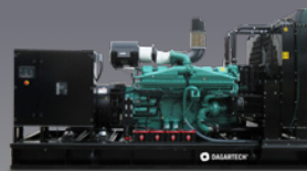
DGC 1000 ST