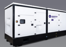
DGBS 1110 ST