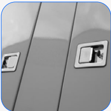
Capot completo de acero inoxidable (304)