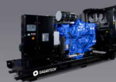
DGB 900 ST