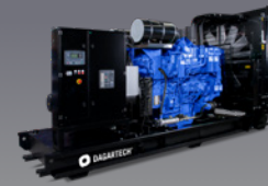
DGB 1110 ST