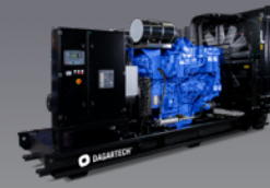
DGB 1000 ST