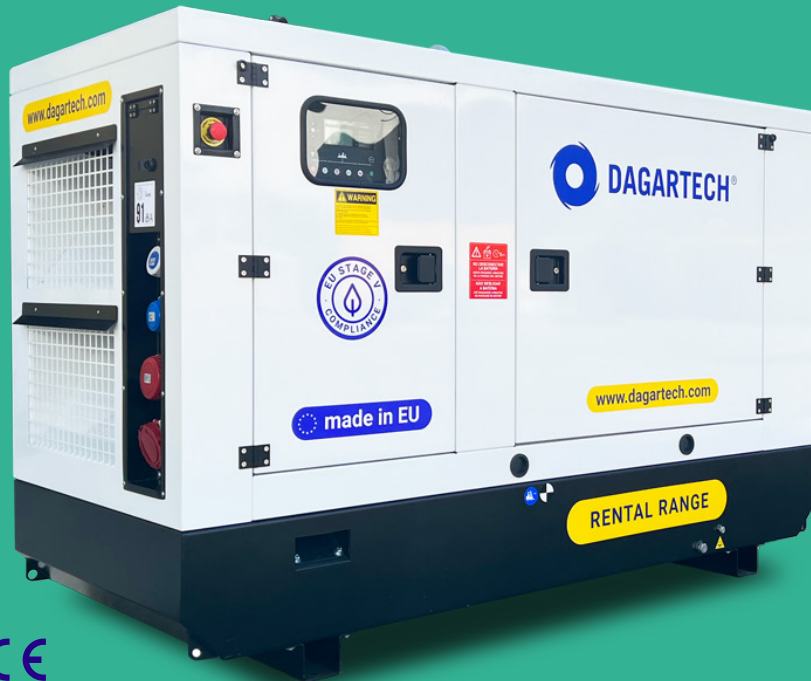
Image indicative. Dagartech se réserve le droit de modifier les données de cette fiche technique sans préavis. Le poids peut varier en fonction de l'équipement.