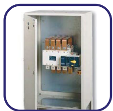
Quadro de comutação motorizada Socomec