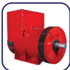
Suplemento do alternador Stamford