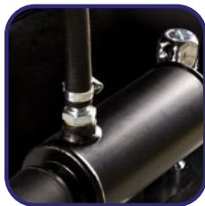
Système de chauffage des moteurs