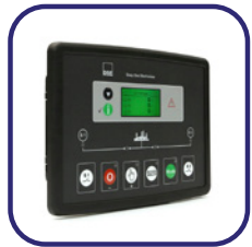
DSE 334 surveillance du réseau