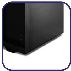
Réservoir de carburant

Nous détaillons ci-dessous un grand nombre d'options de la gamme Industrielle que nous mettons à votre disposition pour faire de votre groupe une machine unique.