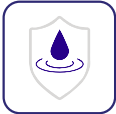
Bandeja de retención con sonda de fugas de líquidos