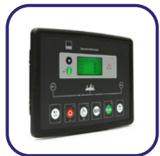
DSE 334 surveillance du réseau