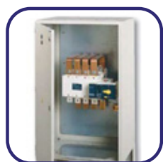
Quadro de comutação motorizada Socomec