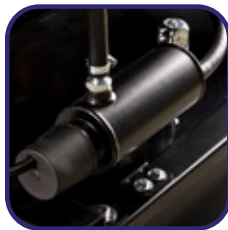
Sistema de caldeo de motor