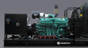
DGC 1250 ME -

• Uso recomendado para aplicações Standby. Dados Indicativos de Potência PRP.