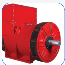
Suplemento do alternador Stamford