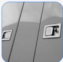
Canópia completa em aço inoxidável (304)