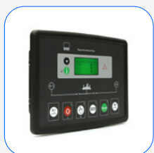
DSE 334 vigilância de rede