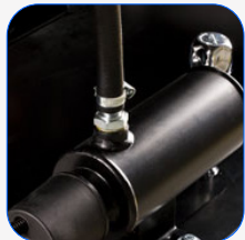
Sistema de pré-aquecimento do motor