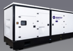
DGBS 1000 ST