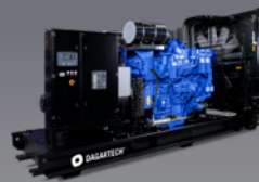
DGB 900 ST