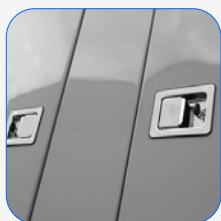
Canópia completa em aço inoxidável (304)