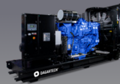
DGB 1000 ST