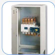
Panneau de commutation motorisée Socomec