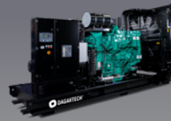
DGC 860 ST