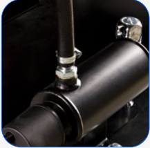
Système de préchauffage du moteur