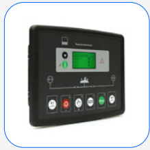
DSE 334 surveillance du réseau